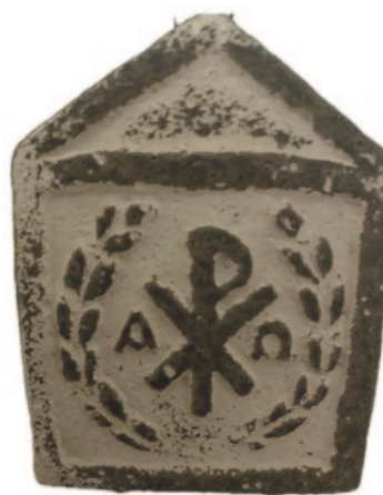
Det äldsta kända kristogrammet, läs Johannes evangelium kapitel 1:1-15.